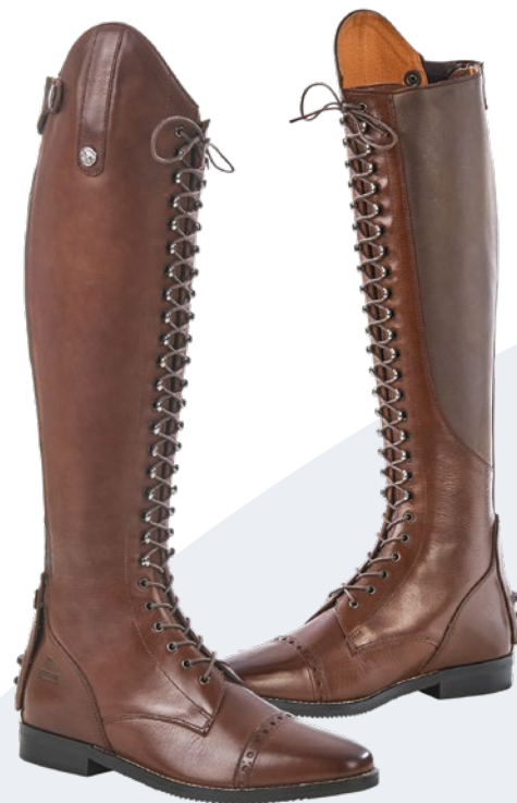
Maße in cm der Reitstiefel LAVAL, braun